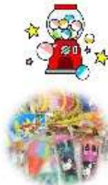
景品イメージです